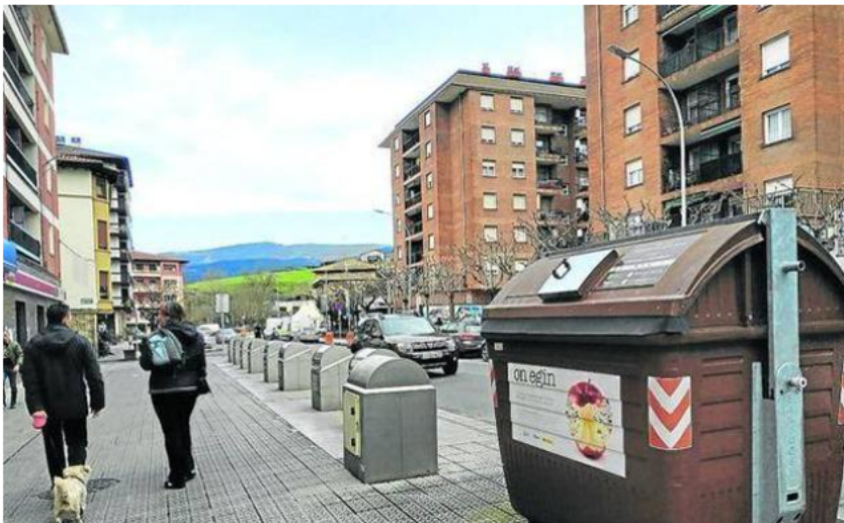
Ejemplo de un contenedor marron de residuos orgánicos en el País Vasco.

Cantabria instalará 2.000 contenedores para el reciclaje de materia orgánica en la comarca con la intención de llegar al año 2023 cumpliendo las directrices marcadas por la Unión Europea